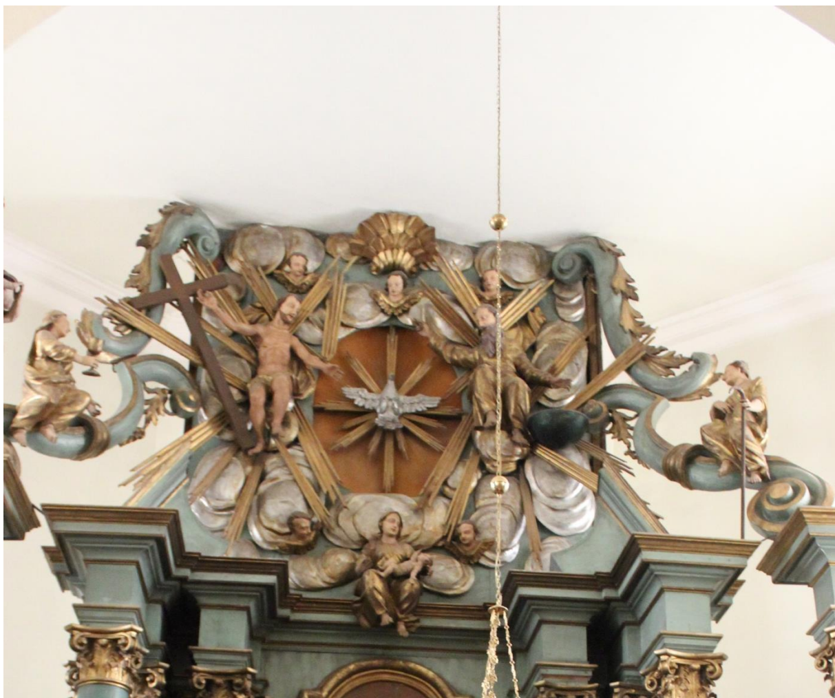
Fot.2. Cisów. Kościół p.w. św. Wojciecha. Ołtarz główny. Fragment , zwieńczenie. Stan przed konserwacją. Widoczne przemalowanie konstrukcji oraz złocień. 2021 r.